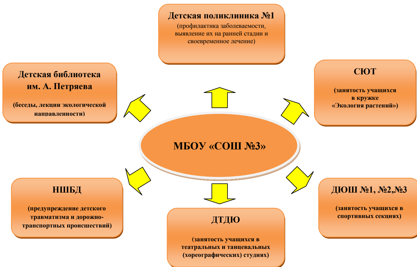
Рис. 2. Сотрудничество школы с другими учреждениями