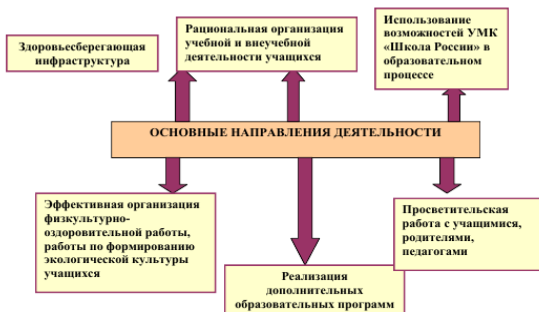
Рис.1. Основные направления деятельности

Работа по формированию экологической культуры, здорового и безопасного образа жизни на ступени начального общего образования ведется по следующим направлениям: